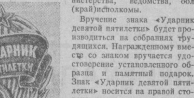
Знаком «Ударник девятой пятилетки» награждаются лучшие рабочие, колхозники, ру-