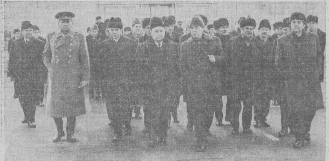
Проводы на Внуковском аэродроме.