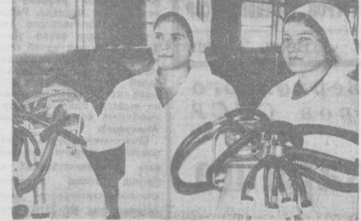
Механизация трудовых работ на молочно-товарных фермах — одна из основных забот руководства совхоза «Ходимки»...