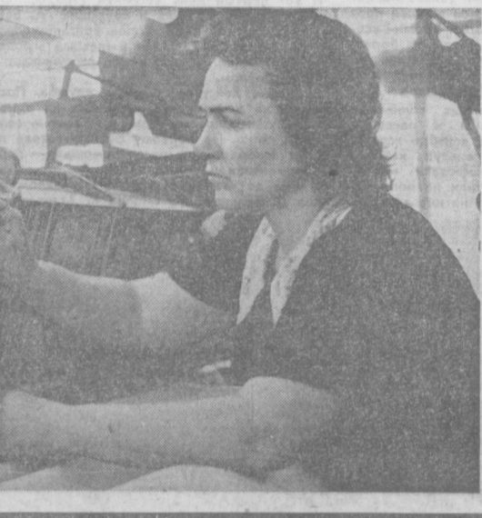
Проверяем выполнение обязательств