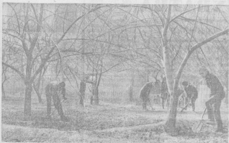
Весна вступила в свои права. В Ташкенте, других городах и поселках республики развернулись работы по посадке деревьев и кустарников. На снимке — учащиеся ташкентской школы № 81 имени Мичурина работают в школьном саду.