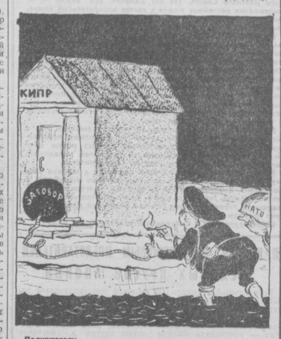
Поджигатели... Рис. И. ТАБАЧНИКА.