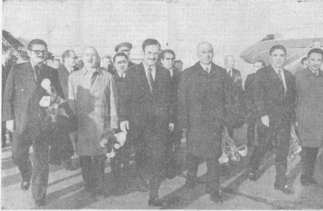
Встреча в Ташкентском аэропорту.

Пономарев, посол СССР в Сирийской Арабской Республике Н. А. Мухитдинов, член коллегии МИД СССР