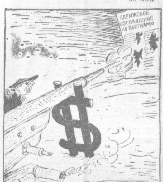
Сайгонские маринетты, оказавшие прямую поддержку войскам США, систематически нарушают парижское соглашение по Вьетнаму.

Министерство иностранных дел Финляндии заявило, что финское правительство поддерживает предложение о предоставлении третьему миру помощи по безопасности и сотрудничеству в Европе на высшем уровне.