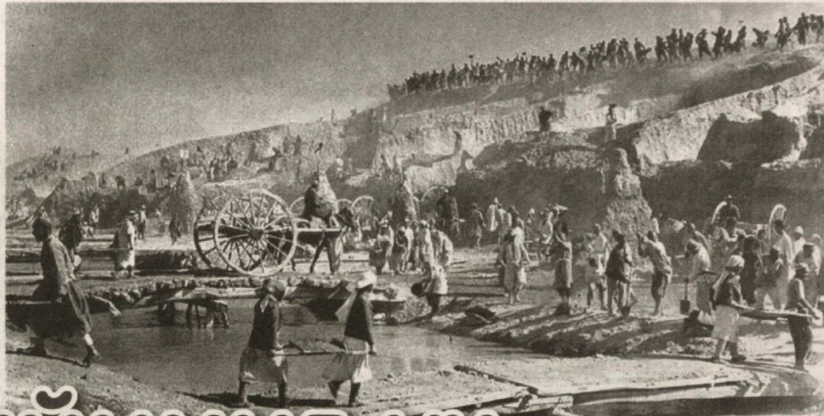
Хамиджон БУРҲОҶОНОВ, "Qishloq hayoti" мухбири.

1939 йилнинг 30 март куни Логон каналининг очилиш маросимида сўзга чиққанлар "Логон канали бу – улкан имкониятлардан амалда фойдаланиш ибтидоси, халқ иродаси билан сув иншоотлари қурилишига шиддат бахш этишдир", дея тарифладилар. Ана шу воқеадан кейин Катта Фаргона каналини халқ ҳашари йўли билан қуриш имкони мавжуд, деган тўхтамга келдилар. Ва шундай бўлди ҳам. Катта Фаргона канали қурилишига қўлидан кетмон уриш, тупроқ чиқариш келадиган барча ишга яроқли кишилар сафарбар қилинди.