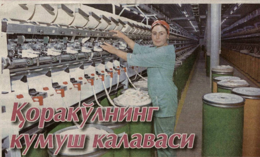
Қоракўлнинг кумуш калаваси Бухоро вилоятидаги "Қоракўл кумуш калава" МЧЖда пахта толасидан юқори сифатли калава ип ишлаб чиқарилмоқда. Жорий йил бошида фаолият бошлаган корхона Германиядан келтирилган замонавий технология билан жиҳозланган. Бу ерда тўқимачилик тармоғи учун кунига 12 тонна калава ип тайёрланмоқда. 120 нафар киши иш билан банд. Маҳсулотни келгусида экспортга йўналтириш режалаштирилган.