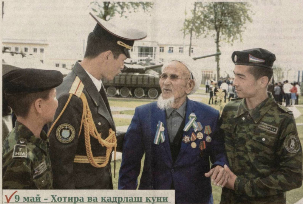
✓9 май - Хотира ва қадрлаш куни