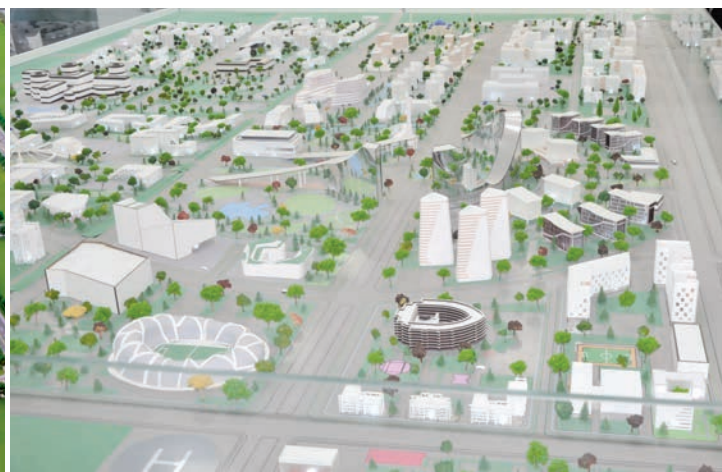
Нурафшон шаҳрида қуриладиган «Ақлли шаҳар» (Smart city)нинг макети

тарга тенг. Мавжуд 22 та маҳалла фуқаролар йиғинида 48 мингга яқин аҳоли истиқомат қилади.