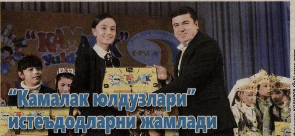
Фарғона шаҳрида "Камалак юлдузлари" болалар ижодиёт фестивалининг вилоят босқичи ғолиб ва совриндорларини тақдирлаш маросими бўлиб ўтди.

2017-2021 йилларда Ўзбекистон Республикасини ривожлантиришнинг бешта устувор йўналиши бўйича Ҳаракатлар стратегиясининг "Фаол инвестициялар ва ижтимоий ривожланиш йили"да амалга оширишга оид Давлат дастурининг 9-бандида фуқароларнинг сайловга оид ҳуқуқларини таъминлашни янада такомиллаштириш вазифаси қўйилган эди. Ўзбекистон Республикаси Конституциясининг 117-моддасига мувофиқ Ўзбекистон Республикасининг фуқаролари давлат ҳокимияти вакиллик органларига сайлаш ва сайланиш ҳуқуқига эгадирлар. (Давоми 2-саҳифада)