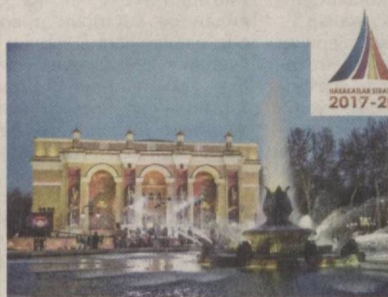
ШАХАР ИЖТИМОЙ-СИЁСИЙ КУНДАЛИК ГАЗЕТАСИ 2017-2021