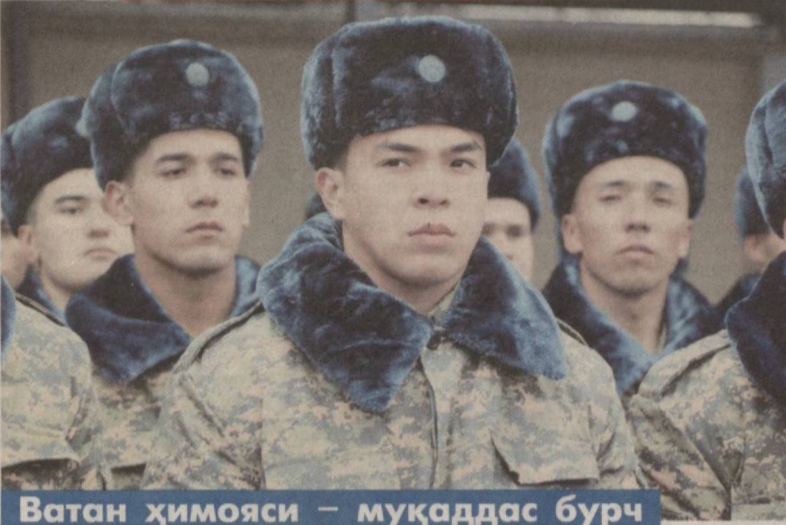
Ватан ҳимояси – муқаддас бурч