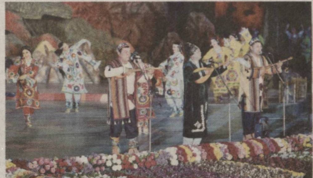
Хабар қилинганидек, Термиз шаҳрида 6 апрель куни Халқаро бахшичилик санъати фестивалининг тантанали очилиш маросими бўлиб ўтди.

Азиз ватандошлар! Бугунги санъат ва нафосат байрами баланд савияда ўтказиш учун астойдил меҳнат қилган барча-барча инсонларга, меҳмондўст ва олижаноб Сурхондарё аҳлига чин юракдан ташаккур билдиришга руҳсат этгайсиз. Барчангизга сийҳат-саломатлик, оилавий бахт, янги ютуқлар ёр бўлсин! Эътиборингиз учун раҳмат.