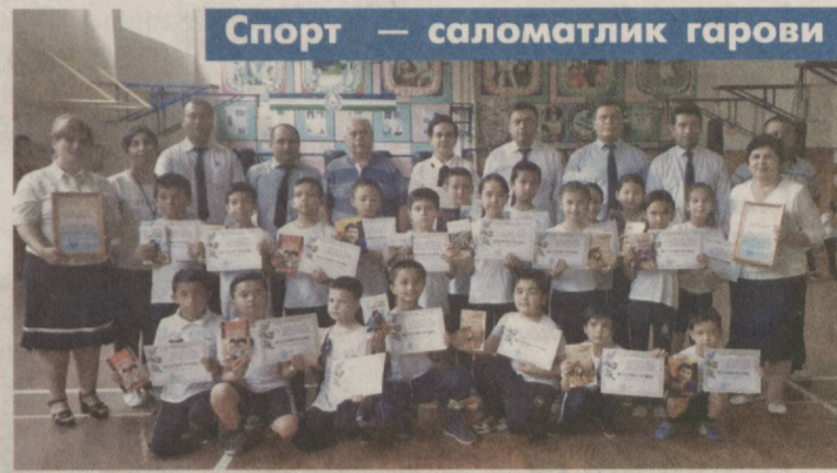
Спорт — саломатлик гарови

Давлатимиз раҳбарининг ёшлар маънавиятини юксалтириш ва уларнинг бўш вақтларини мазмунли ташкил этиш бўйича бешта муҳим ташаббусини ҳаётга татбиқ этиш бўйича ўқув мусабасаларида турли-туман тадбир амалга оширилмоқда.