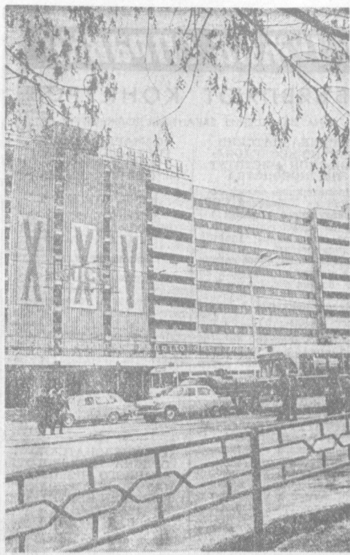
Не только в трудовом ритме страны, но и в самом обличии городов Страны Советов чувствуется приближение исторического события в жизни Советского Союза — XXV съезда КПСС. Кучанов, транспортант и лозингов, ухаживают за ними. Вдоль улиц мимолетно съезды «XXV». На снимке: на Первомайской улице Ташкента.