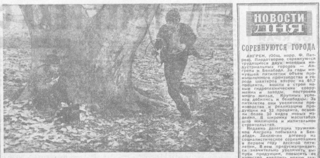
Ташкентская школа № 89 по организации военно-патриотического воспитания учащихся является одной из лучших в городе. Здесь имеется прекрасно оборудованный военный кабинет, тир, Гуманитарный музей боевой славы. Радиолобители посещают организованный в школе кружок. Сейчас они готовятся к весенним спортивным играм. На этом снимке: момент радиомыгры «Охота на лиса». У передатчика — Олег Луинин, с приемником — Володя Язын.

Поднятые в статье вопросы укрепления творческого коллектива специалистами, их бытового устройства будут вновь поставлены управлением культуры перед соответствующими организациями. Правильно указано в статье, что областное управление культуры недостаточно занимается анализом идейно-художественной ценности спектаклей и концертных программ театра. Намечены конкретные меры для устранения недостатков.