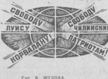
Рис. В. ЖУКОВА.