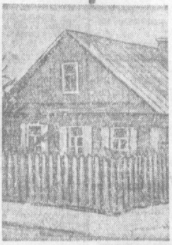
Дом в Минске, где проходил Первый съезд РСДРП.

БЛИЗТ С Я XXV съезд Коммунистической партии Советского Союза.