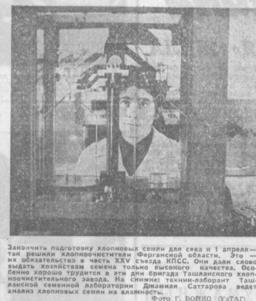
Зачисление подготовленных семян для севы и 1 апреля — в честь юбилейной даты.