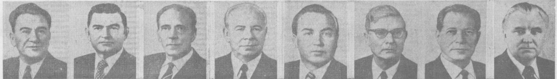
Д. А. КУНАЕВ. Член Политбюро ЦК КПСС.