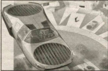
"The Lilium Jet"

Неча йилдирки, автомобилларнинг ҳавода парвоз этиши ҳақидаги тасаввур одамзодга тинчлик бермайди. Яқинда Мюнхендаги "Lilium Aviation" компанияси икки нафар йўловчига мўлжалланган учар автомобилни синовдан ўтказди. Бу ҳақида "Hi-news" технология портали хабар қилди.