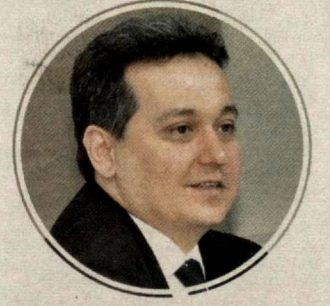
Шерзод ШЕРМАТОВ, Ўзбекистон Республикасини Халқ таълими вазир:

— Инсон муайян ютуқларга эришишда ота-онаси, оиласи, устозларининг хизмати қатта бўлади. Менинг ҳаётим ҳам истисно эмас.