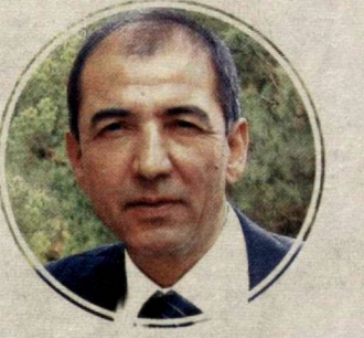
Сирожиддин САЙИД, Ўзбекистон халқ шоири:

— Мен онамнинг фарзанди бўлмаганимда, онам менга она бўлмаганида — менга бундайин саодат икки дунёда ҳам насиб этмаслигини қомил ишонч билан айта оламан.