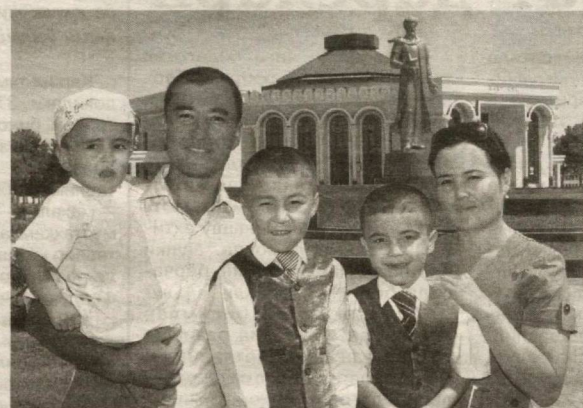
Ший шароитларнинг анча на- мунали йўлга қўйилгани қувон- нарли, албатта.

Соғ-саломат юришининг му- ҳим шарти танани пок ва тоза сақлашдир. Қишлоқ шароити- да ҳаммом бўлса, яхши. Аммо бунга маҳаллий ҳокимликлар кўп ҳам эътибор беравермай- ди. Ателье, новвойхона, сарта- рошхона, қосиблик устaxonаси очилиши мумкин, лекин ҳам- момга қўзиниш тушганми? Шу боис маҳаллий ҳокимлик томо-