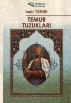
buyuk shaxsgina yoza olardi.

"Temur tuzuklari" zamon zarurati va talabi bilan yaratilgan asardir. Uni davlatni boshqarish zhamatlarini o'z boshidan kechirib, bu borada ulkan tajriba orttirgan, mashhur muarrix Nizomiddin Shomiy ta'biri bilan aytganda esa, "kamolot-u martabalariga o'zining yetuk sa'y-harakati va jon-jahdi bilan erishgan" Amir Temurdek