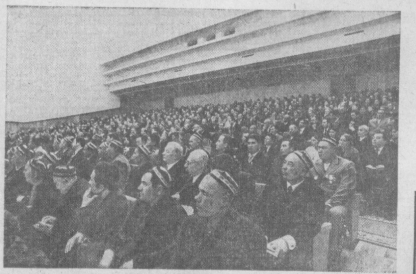
На снимке: в зале заседания курултай.

Издательство «Каракалпак» выпустило в свет на каракалпакском языке второй том книги Л. И. Брежнев «Ленинским курсом». Книга издана массовым тиражом.