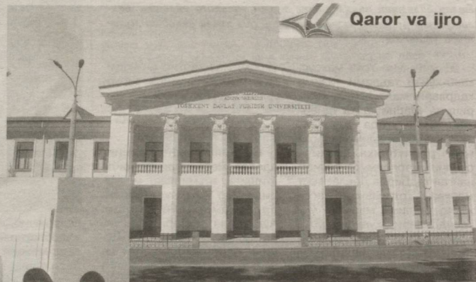
Qaror va ijro

— Кредит тизимининг жорий этилиши талабанин академик мо-