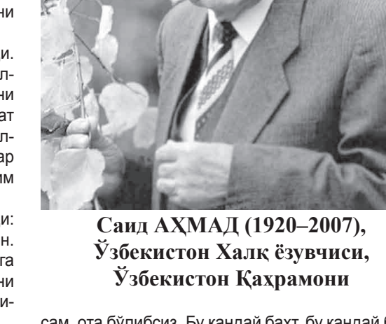
Санд АХМАД (1920–2007), Ўзбекистон Халқ ёзувчиси, Ўзбекистон Қаҳрамони

Эътибор бу баҳонани беихтиёр топди. Бу – зўр баҳона. Ҳеч қандай эр хиёнат қилган хотинни кечиролмайди. Бутун умрини болу пардек покиза ўтказган хотин, хиёнат у ёқда турсин, Беғона эркакини хаёлига келтирмаган хотин ўзини ўзи энг пасткашлар қаторига қўйиб ўтирибди.