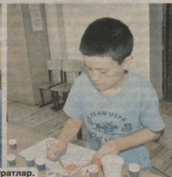
Б.РИЗОҚУЛОВ олган суратлар.