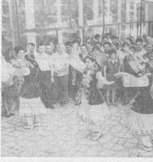
Артисты ансамбля песни и танца Каракалпакского телевидения и радио выступают перед рабочими фирмы «Юдуз».