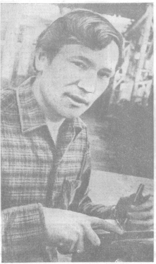
Сотни рабочих завода «Узбекхиммаш»...