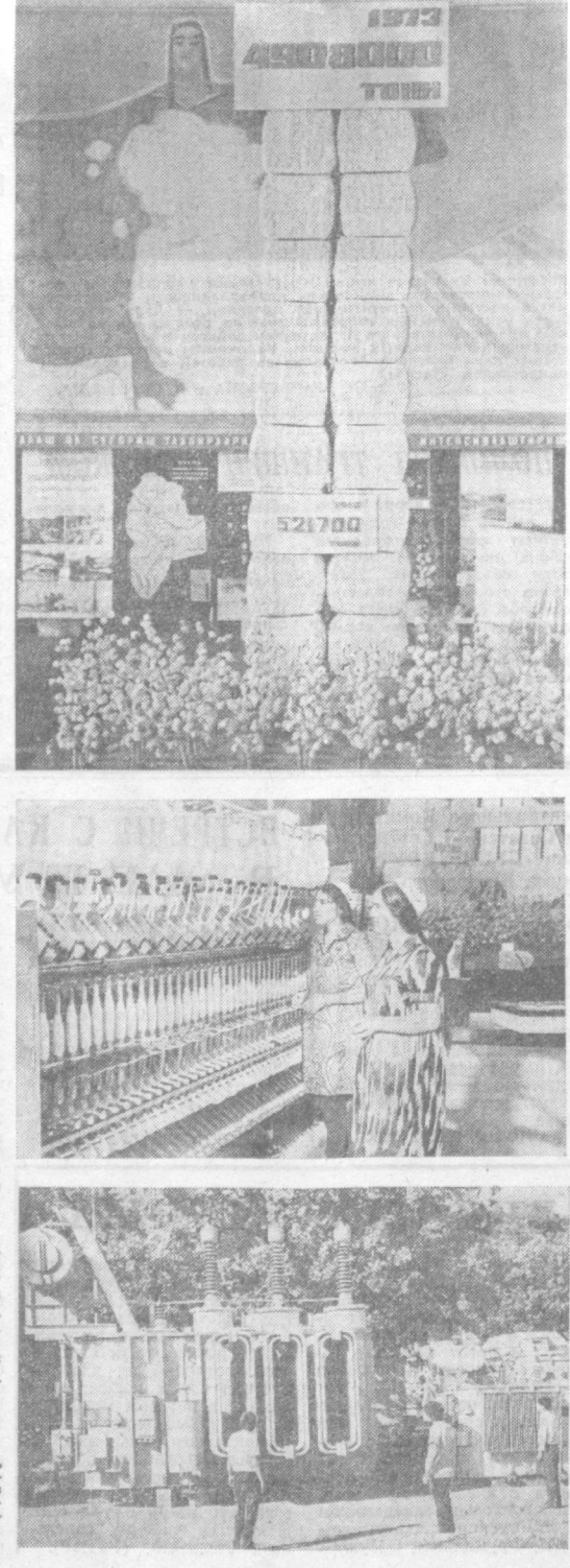
На снимках: хлопок — гордость наша; марна «Ташкентильмаш» широко известна в стране; и за рубежом; трансформаторы у нас строят в Чирчике, Намангане, Коканде.

А с чем сравнить нашу сеть газопроводов? «Голубое топливо» вошло в каждый дом. А я помню такую картину: в милах все стены дула облеплены кирпичом. Кислородом топлив еще после войны. Теперь мы извлекаем из