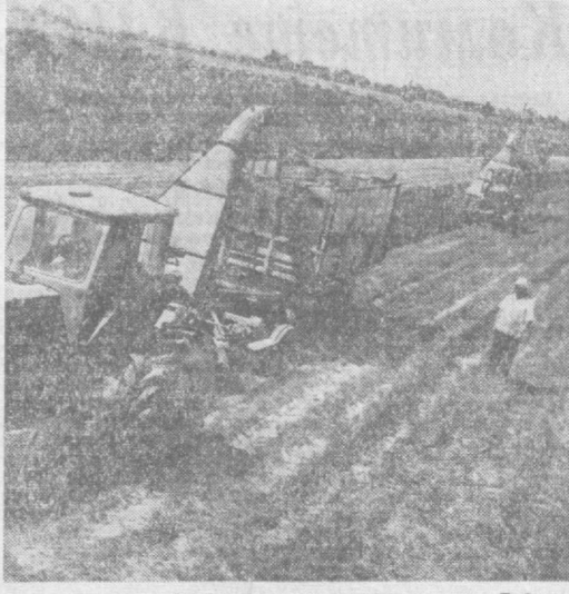
Хорошей травостой на люцерновых полях колхоза «Победа» Нарпайского района. С каждого из 540 гектаров полей, входящих в севооборот, получено по 107 центнеров люцернового сена. Во наступления холодов планируется провести еще три уноса и довести урожай с каждого гектара до 180 центнеров. На снимке: второй унос люцерны на полях хозяйства.