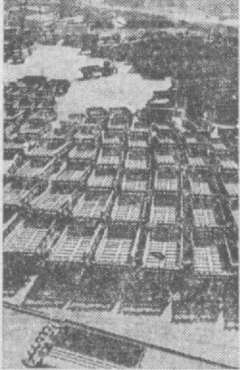
ЛАТВИЙСКАЯ ССР. Камды шесть минут с новейшей римонской завода сельскохозяйственного машиностроения «Рига» сходит с конвейера. Решающую роль в ритмичном выпуске высококачественной продукции играет социалистическое соревнование под девизом «Пятилетка качества — рабочую гарантию». На снимке: продукция завода.