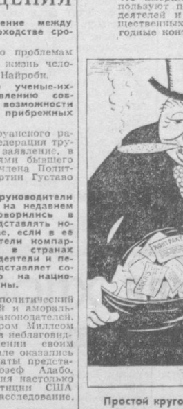
Рис. А. МАЙЛЯЦА.