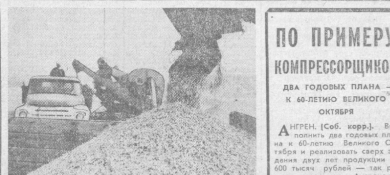
Коллектив самого крупного в Сырдарьинской области зерно-подготовительного совхоза «Хаваст» решил в нынешнем году собрать 17 тысяч тонн и сдать государству 8 тысяч тонн зерна вместо предусмотренных планом 4 тысяч тонн. На государственный заготовительный пункт уже поступило почти 10 тысяч тонн. На снимках: сверху — уборка пшеницы на полях второго отделения, внизу — идет очистка зерна на совхозном току.