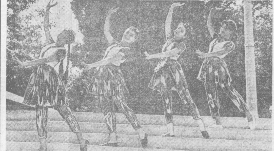
Ансамбль «Юлдуз» республиканского Дворца пионеров извещен не только в нашей стране. Его участницы не раз с успехом выступали за рубежом. На снимке: репетиция.

Программа занятий издана в виде брошюры, ее имеет каждая слушательница. Аналогичный университет создан в совхозе имени Кирова Кировского района. В каждом районе Ферганской области сейчас действует от двух до шести народных университетов культуры.