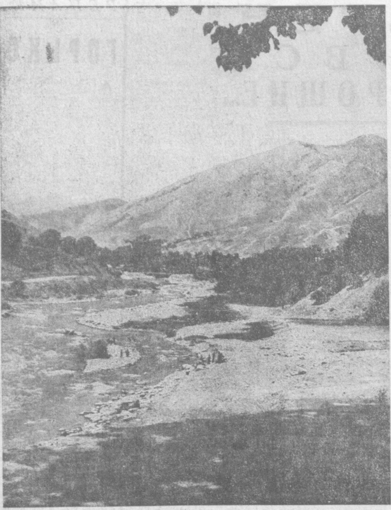
по родному краю. В горах Хумсана.