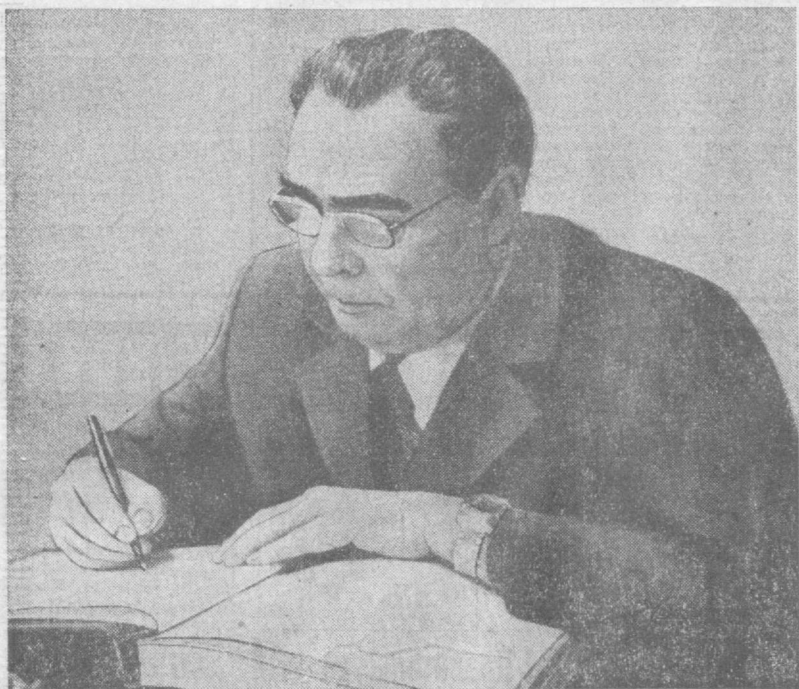
1 августа 1975 года, Хельсинки. Генеральный секретарь ЦК КПСС Л. И. Брежнев подписывает от имени Советского Союза Заключительный акт Совещания по безопасности и сотрудничеству в Европе.

№ 179 (1815) Воскресенье, 1 августа 1976 года Цена 2 коп.