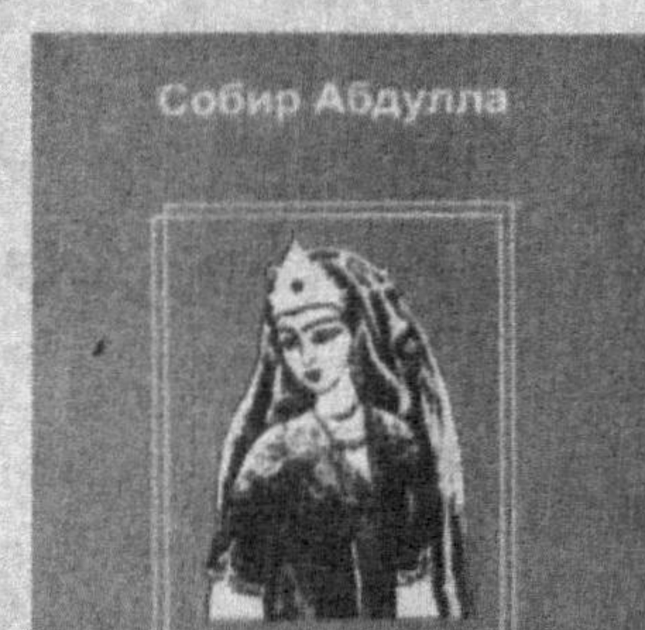
Зебо этиб кет...