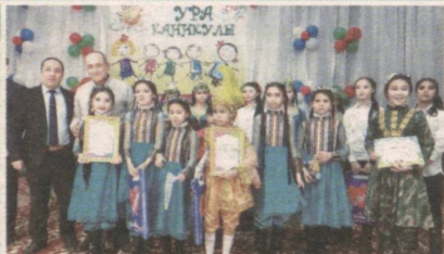
«Давоми. Боши 5-саҳифада»