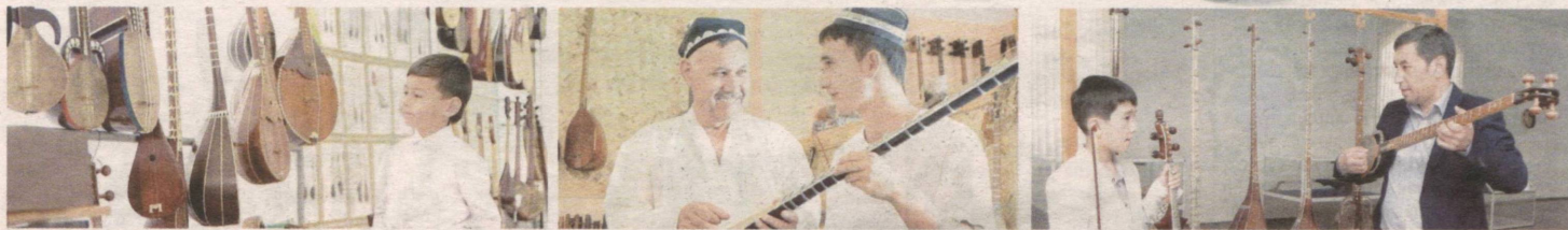
Инсон ҳаётининг ҳар лаҳзасини ранг-баранг муסיқа орқали ҳам тасвирлаш мумкин. Умримиз давомида бўлиб ўтаётган воқеалар билан боғлиқ ҳолда муסיқани тинглаймиз, хиргойи қиламиз ёки чолғуда ижро этамиз. Куй ёки қўшиқ яшаш тарзимиз мазмунини янада бойитади. Бунда чолғу ижрочилиги, айниқса, халқ чолғу ижрочилиги муҳим аҳамият касб этади.

Маълумотларга кўра, чолғу асбобларининг эраминдан аввалги ўн саккиз минг йилликда дунёга келган. Муסיқа асбоблари орасида энг аввал зарбли чолғулар пайдо бўлиб ибтидоий жамоа тузumi даврданоқ турли кўринишларда ривожлана бошлаган. Дастлаб зарбли товуш чиқарувчи турли воситалар билан ҳайвонларни ҳайдашган, сўнг чолғулар такомиллаштирилади хил кўнгилочар рақслар ёки ўйинларда кенг фойдаланишган. Жамиятнинг пайдо бўлиши ва инсоният ривожини янги чолғу асбобларининг яралиши, уларнинг шаклланишига сабаб бўлди. Булардан най, сурнай, шикилдок, чилтор ва шу каби бошқа чолғулар, кейинчалик торли-мизробли ҳамда торли-камонли чолғуларнинг яралиши мисол бўлиши мумкин.