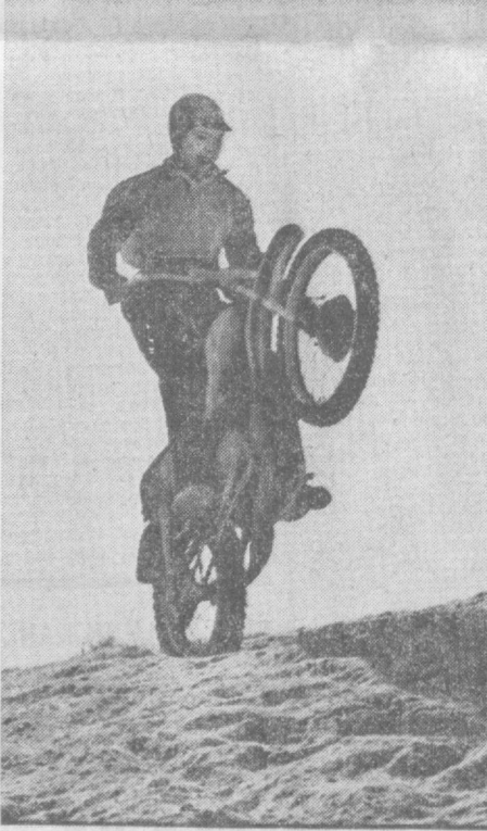
Ну, чем не каскадер?