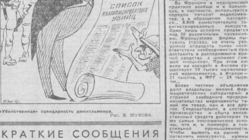
«Убийственная» солидарность джентльменов. Рис. В. ЖУКОВА.

Более честное объяснение дают владельцы мелких фармацевтических предприятий в странах свободного предпринимательства: медицина — та же товар, как и все другие. Производство и сбыта лекарственных средств действуют те же самые законы рыночной экономики, что и в промышленности, что и в криминале, в текстильной промышленности. Чтобы выжить на рынке и получить прибыль, фармацевтические фирмы вынуждены искать новые сочетания и «инновации».