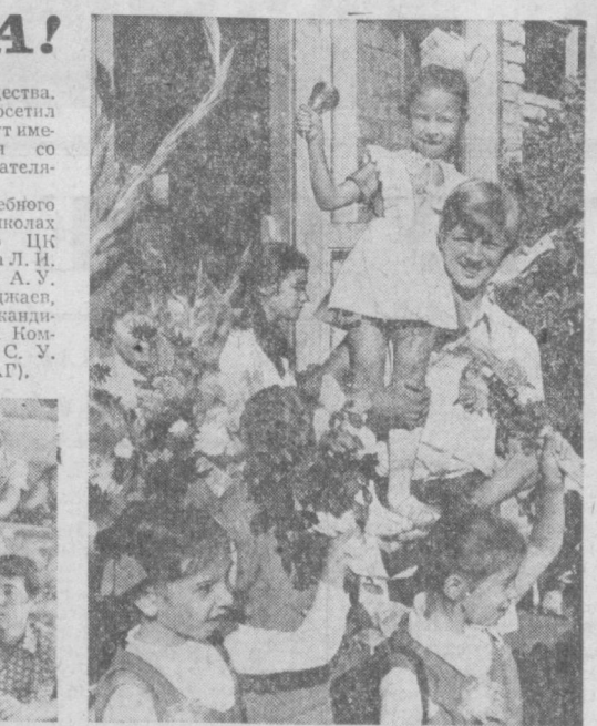
Гостеприимно распахнулись вчера двери учебных заведений и школ столицы республики. Тысячи студентов и школьников вновь заполнили аудитории, кабинеты и классы. На сцене: первая лекция у студентов 1-го курса инженерно-физического факультета политехнического института имени Беруни. Первым звонком в школе № 164 Чиназдарского района.