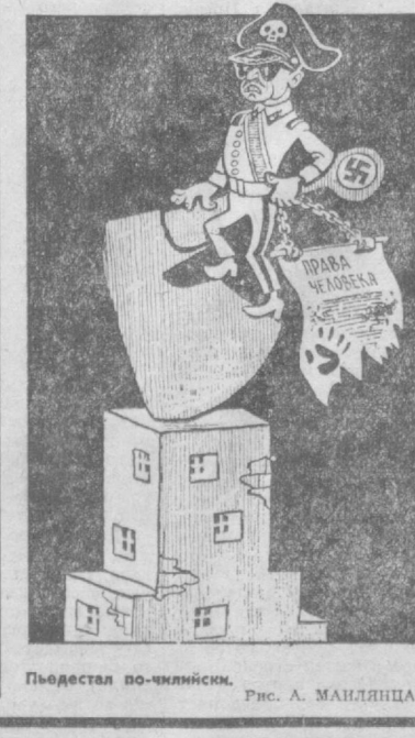
Пьедестал по-чилийски. Рис. А. МИЛЛИЦА.