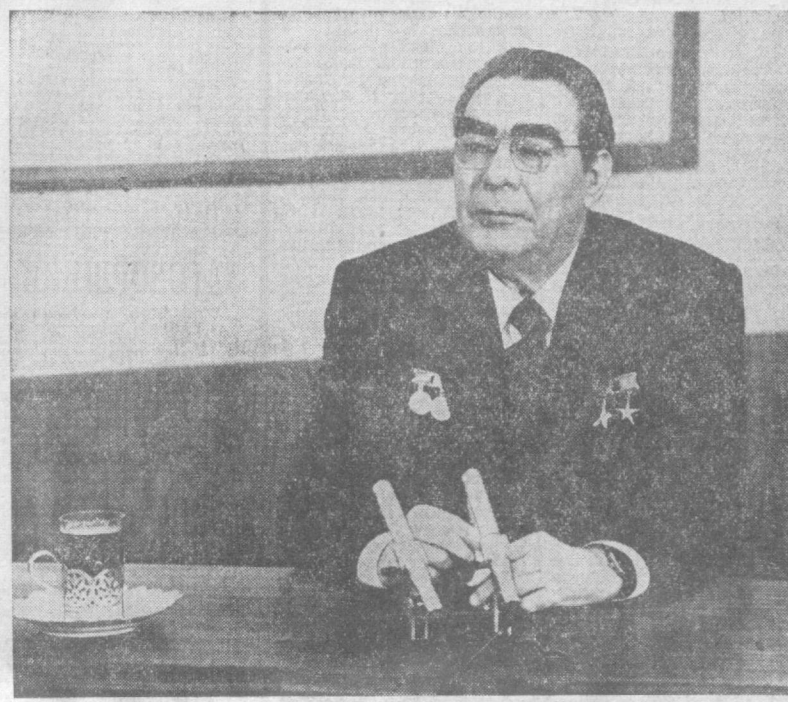
Генеральный секретарь ЦК КПСС Л. И. Брежнев дает интервью Французскому телевидению.

Конечно, мы не забываем и о количественной стороне дела. Наша страна и сейчас уже обеспечивает 20 процентов мирового промышленного производства (хотя в Советском Союзе живет всего 6 процентов населения Земли). Однако за пятилетку мы хотим увеличить объем индустриальной продукции еще на 36 процентов. Можете себе представить, что