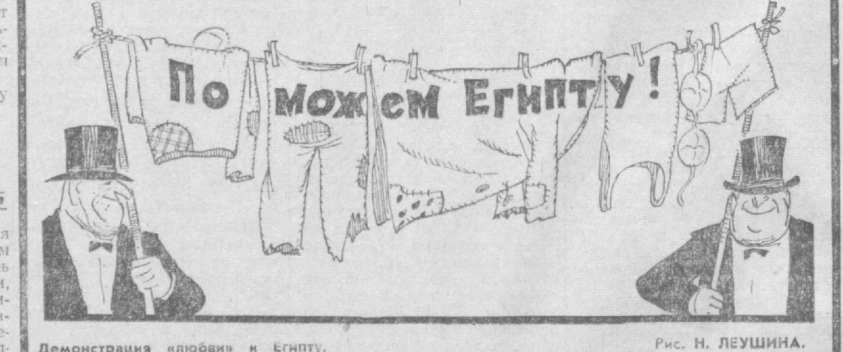
Рис. Н. ЛЕУШИНА.

Американские монополии не горят желанием быстро высвободить доллары в единственную экономическую. Зато они в виде оказания помощи выстраивают на эфиопский рынок больше партии поношенной одежды. (Из газет).