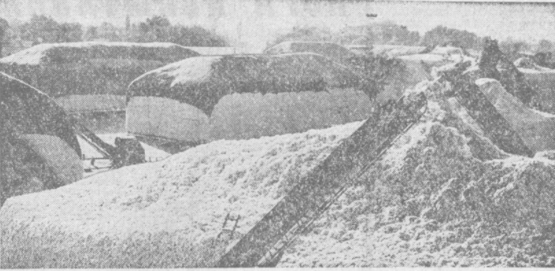
С каждым днем увеличиваются бунты хлопка нового урожая на Пайтусском производственном пункте. Здесь уже сосредоточено более 40 тысяч тонн сырья, снятого в колхозах и совхозах Избасанского района.