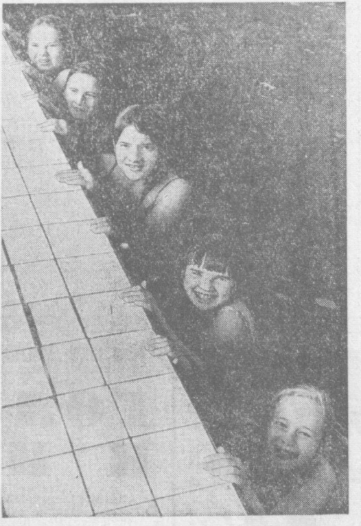
Еще одна, четвертая по счету, новал детская спортивная школа открылась в Алматы. Здесь занимаются юные гимнасты и пловцы. В городе спортшколами охвачено более тысячи детей горняков. На снимке: участники секции фигурного художественного плавания.