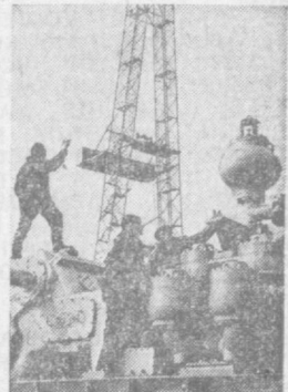
СВЕРДЛОВСКАЯ ОБЛАСТЬ. Эта буровая установка с дизель-генераторным приводом предназначена для проходки сверхглубоких разведочных нефтяных и газовых скважин. Она изготовлена на Уралмашзаводе. Новый агрегат будет отправлен геологоразведчикам «Грознефти».