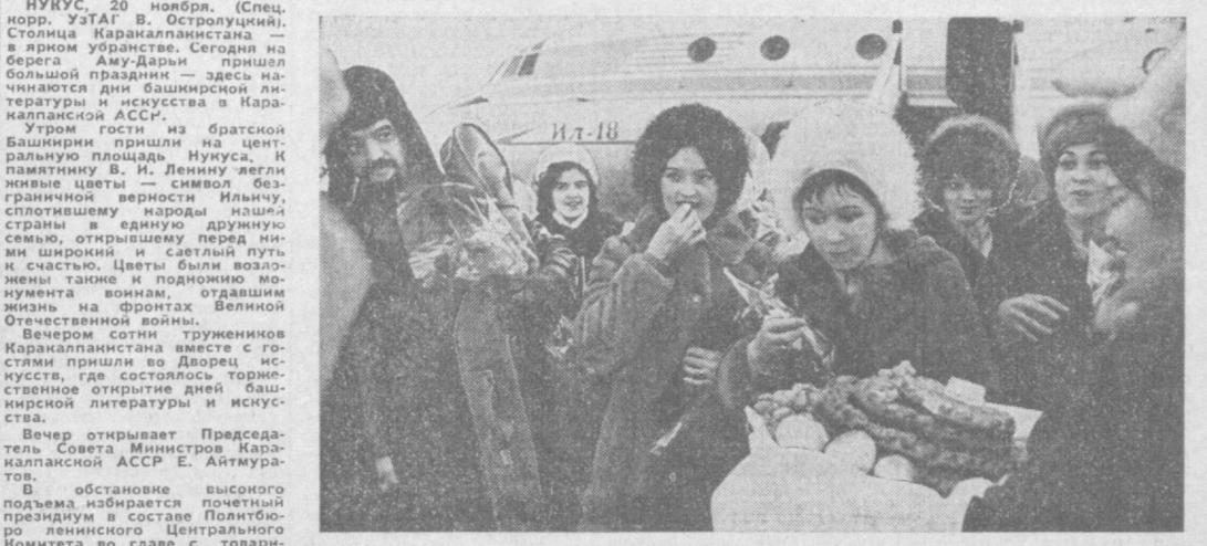
Вчера в Каракалпакии открылись дни литературы и искусства Башкирской АССР. На снимке: гости из Башкирии в аэропорту Нукуса.