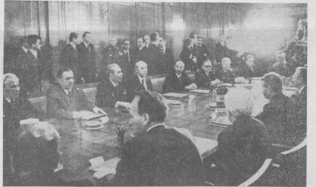
Во время переговоров.