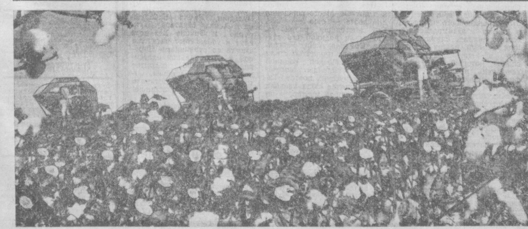
В дни уборки на полях колхоза имени Горького Туркменского района.

К. НУРУМБЕТОВ, Первый секретарь Туркменского района КП Узбекистана.