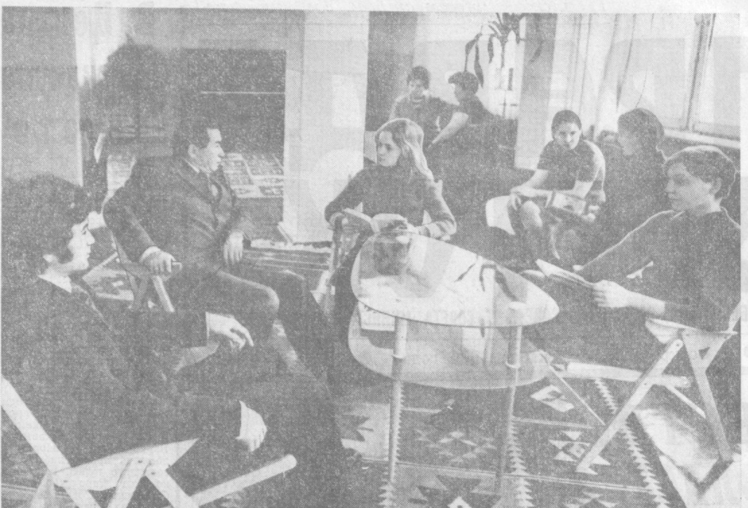
ПОД СЧАСТЛИВОЙ СОВЕТСКОЙ ЗВЕЗДОЙ

Отмечалось, что в текущем пятилетии трудящимся Намангана предстоит осуществить большую программу созидательных дел. Средства на реконструкцию действующих мощностей возрастут на 41 процент. К концу пятилетия годовая объем заготовок хлопка намечается довести до 500 тысяч тонн. Для успешного решения этих задач, подчеркивали выступавшие, необходимо шире развернуть социалистическое соревнование, творчески подходить к разработке и принятию встречных планов.