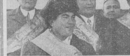
Героям страны — 76 было доверено поднять государственные флаги СССР и Узбекской ССР на празднике «Хосид байрама».