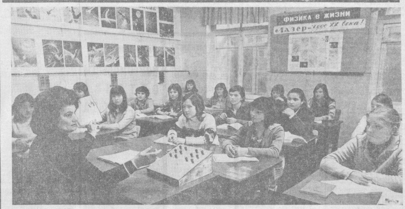
ПОД СЧАСТЛИВОЙ СОВЕТСКОЙ ЗВЕЗДОЙ

В. ПЕТРОВ, Соб. корр. «Правды Востока», Гуверсий район.