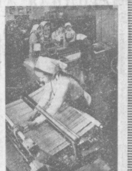
За шесть лет существования тагикстанского профессионально-технического училища № 85 здесь было подготовлено свыше двух тысяч прядильщиц и ткачих, которые работают на текстильных комбинатах и ткацких фабриках республики. На снимке: учащиеся училища на практических занятиях.