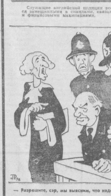
Рис. Р. ЛЕВИЦКОГО.

КРАТКИЕ СООБЩЕНИЯ В Карансе завершила работу сессия бюро Президиума Верховного Совета Узбекской ССР. Стратегический курс на развитие экономики страны, повышение уровня жизни населения, укрепление дружбы и сотрудничества с народами других стран — это основные задачи, поставленные перед органами власти республики на предстоящий год. Серьезным осуждением в Западной Германии воспринимается обострение конфликта между известными как «красные» и «черные» профсоюзы, выступившие делегаты антивоенных в Берлине. Конференция направлена на укрепление процесса разрядки международной напряженности, за мир во всем мире. Соединенные Штаты будут продолжать оказывать помощь в развитии экономики Южной Америки. В частности, США Дн. Парки в интервью газете «Нью-Йорк таймс», Вспрос о выделении 60 млн. долларов в виде кредита Фашистскому режиму в Чили будет рассматриваться на этой неделе на заседании правления банка.