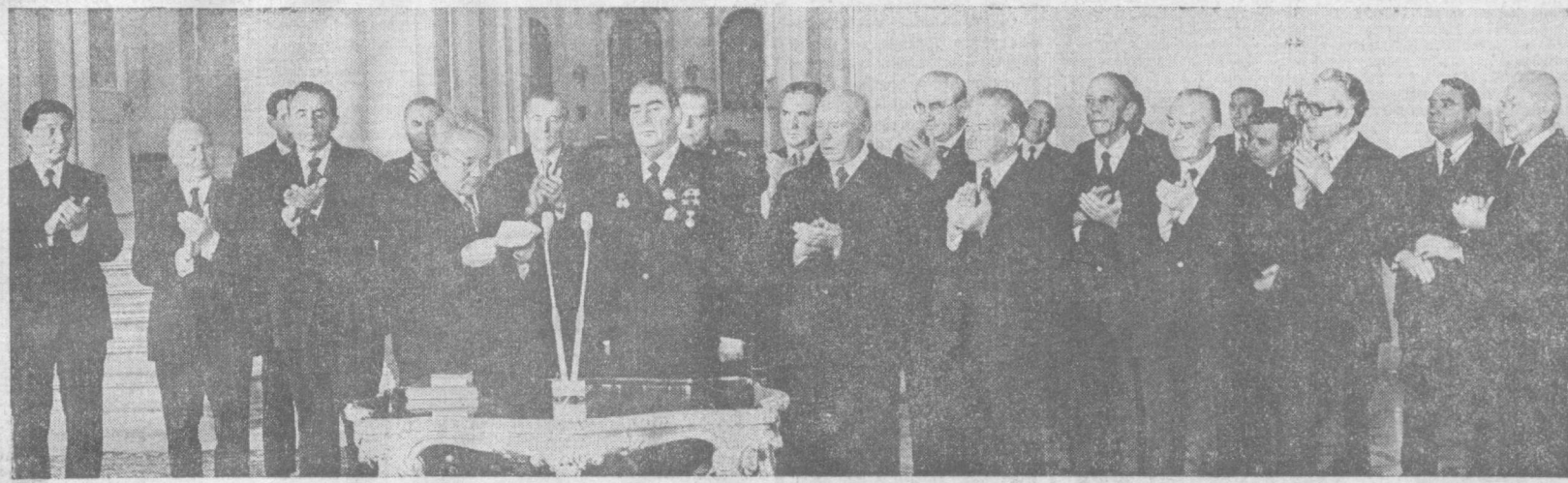
Во время вручения наград.

В работе съезда принимают участие делегации КПСС во главе с членом Политбюро ЦК КПСС М. А. Сусловым, ЦК КПСС М. А. Сусловым, ЦК КПСС М. А. Сусловым, ЦК КПСС М. А. Сусловым.